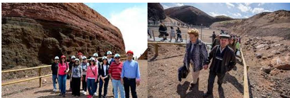
Figura 11. Fotografías de visitas al exo-museo del volcán de Cerro Gordo

La experiencia llevó a las instituciones implicadas a dar un paso más en los objetivos que persigue la resolución de la UICN firmando, en 2021, un nuevo convenio para plantear una ampliación del actual exomuseo mediante la creación de “Calatrava Vulcano: Complejo Volcánico de Cerro Gordo”.