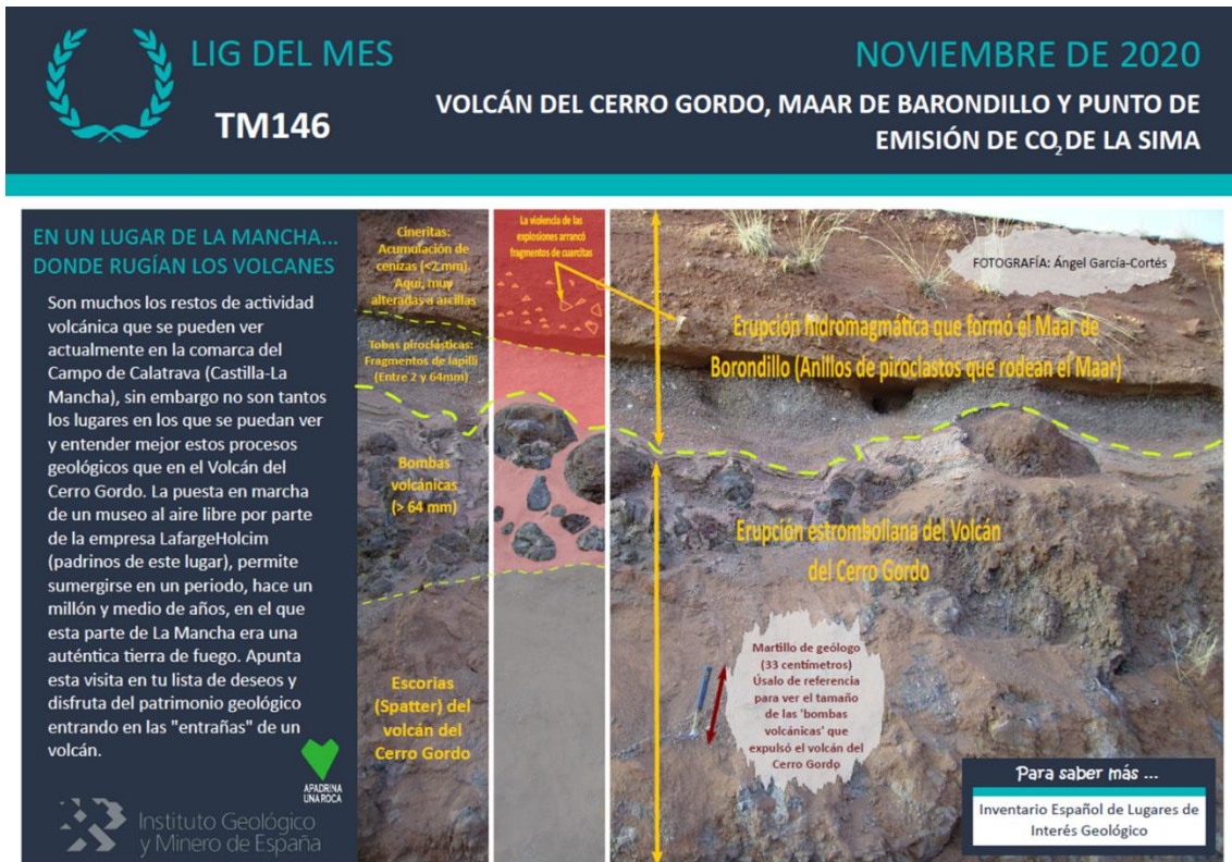
Figura 7. Cartel conmemorativo del Lugar de Interés Geológico donde se ubica la cantera de San Carlos, de LafargeHolcim

En ella se ha acondicionado un espacio para la creación de un museo al exterior (exomuseo) que permite visitar y poner en valor el patrimonio geológico que ha quedado expuesto.