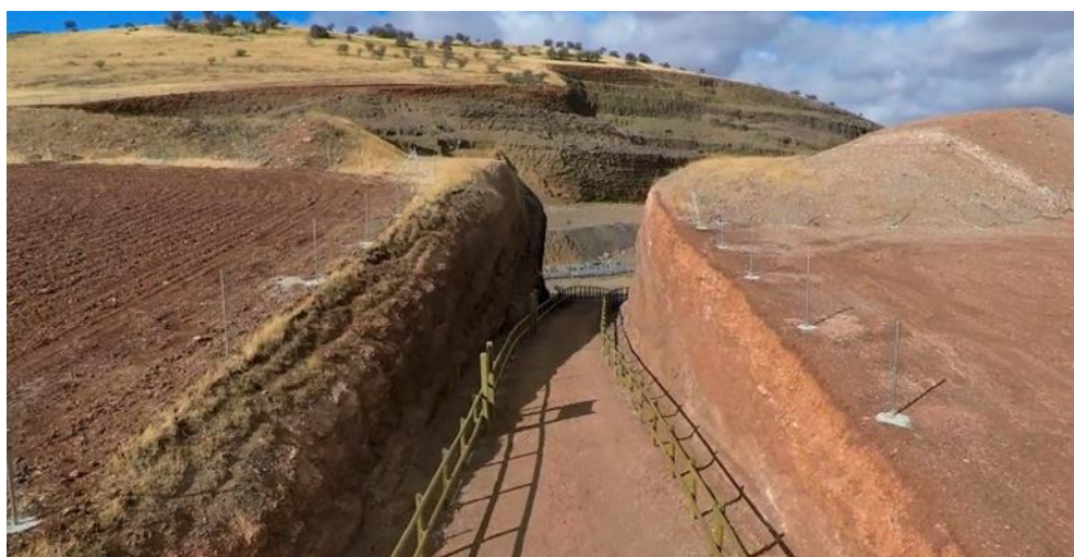
Figura 9. “Entrada al volcán”, acceso independizado a la cantera para uso público