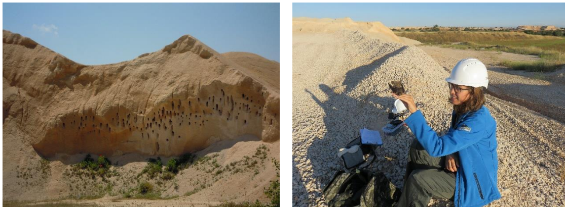
Figura 5. Colonia de aviones zapadores en canteras de áridos

RESOLUCIÓN DE LA UICN SOBRE CONSERVACIÓN DEL PATRIMONIO NATURAL EN ENTORNOS MINEROS. Caso de la cantera de LafargeHolcim en el volcán de Cerro Gordo