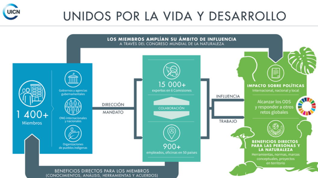
Figura 1. Gobernanza UICN

La Unión Internacional para la Conservación de la Naturaleza (UICN) es una asociación internacional, formada por gobiernos nacionales y subnacionales y agencias gubernamentales, así como organizaciones no gubernamentales y de pueblos indígenas de más de 160 países.