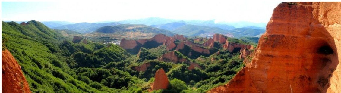
Figura 4. Vista panorámica de Las Médulas.

RESOLUCIÓN DE LA UICN SOBRE CONSERVACIÓN DEL PATRIMONIO NATURAL EN ENTORNOS MINEROS. Caso de la cantera de LafargeHolcim en el volcán de Cerro Gordo