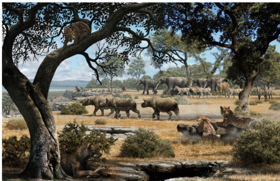
Figura 3. Representación paisaje cuenca de Madrid hace unos 10 millones de años

RESOLUCIÓN DE LA UICN SOBRE CONSERVACIÓN DEL PATRIMONIO NATURAL EN ENTORNOS MINEROS. Caso de la cantera de LafargeHolcim en el volcán de Cerro Gordo