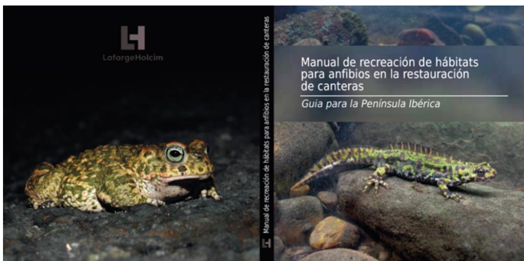
Figura 6. Manual de recreación de hábitats para anfibios en la restauración de canteras

Otro caso son las oportunidades en los entornos mineros para la recreación de hábitats acuáticos diversos, como charcas, pequeñas lagunas o arroyos temporales, enclaves para especies vulnerables ligadas a estos medios escasos, como los anfibios.