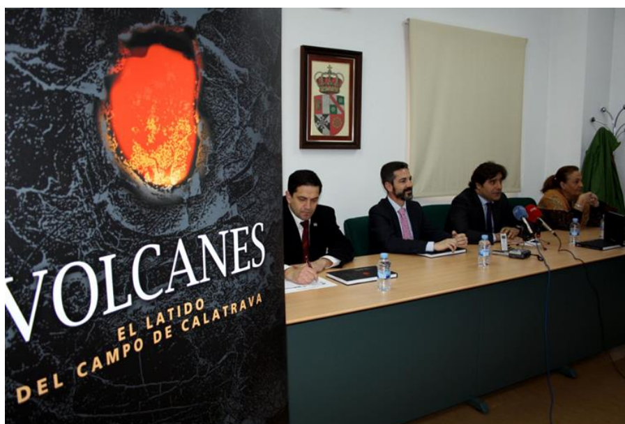
Figura 8. Presentación del libro VOLCANES, el latido del Campo de Calatrava