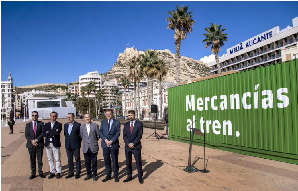
Figura 6: Mercancías al tren en Alicante con Ximo Puig, presidente de la Comunidad Valenciana.