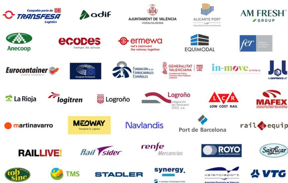
Figura 4. Colaboradores Mercancías al tren.

En esta iniciativa, un grupo de organizaciones entre las que se encuentra Transfesa Logistics, se han sumado a la campaña iniciada en Alemania por la empresa DB Cargo para impulsar el transporte de mercancías por ferrocarril. “Mercancías al tren” es como se llama este proyecto en España, que se ha desarrollado en el marco del Año Europeo del Ferrocarril celebrado durante el 2021 y que busca concienciar tanto a las instituciones públicas, como al sector empresarial y a la sociedad en general de la importancia de trasladar carga de la carretera al tren para reducir las emisiones del sector transporte que es el responsable de un 27,5 % de las emisiones totales en nuestro país según el último informe anual del Observatorio del Transporte y la Logística en España (2020) de marzo de 2021.