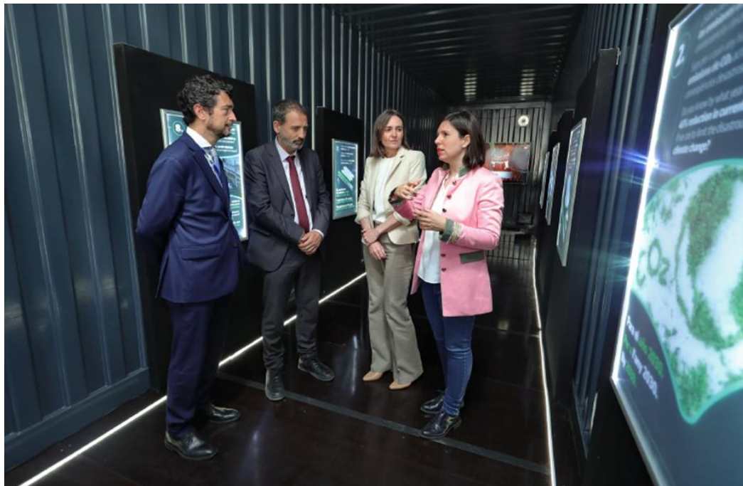
Figura 7: Dentro del contenedor, donde se muestra la exposición de la campaña en Barcelona, con la presencia del secretario de estado de Infraestructura, Xavier Flores, el presidente del Port de Barcelona e Idoia Galindo CEO de Transfesa Logistics.