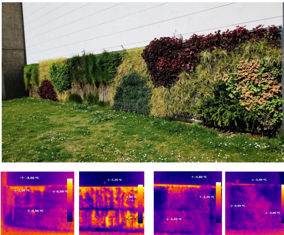
Figura 2. Ejemplo de piloto de Fachada Verde en CARTIF. (Fundación CARTIF)

muestran las diferencias térmicas entre los distintos paneles de ensayo y entre la pared superior desnuda, para un periodo de frío intenso en invierno.