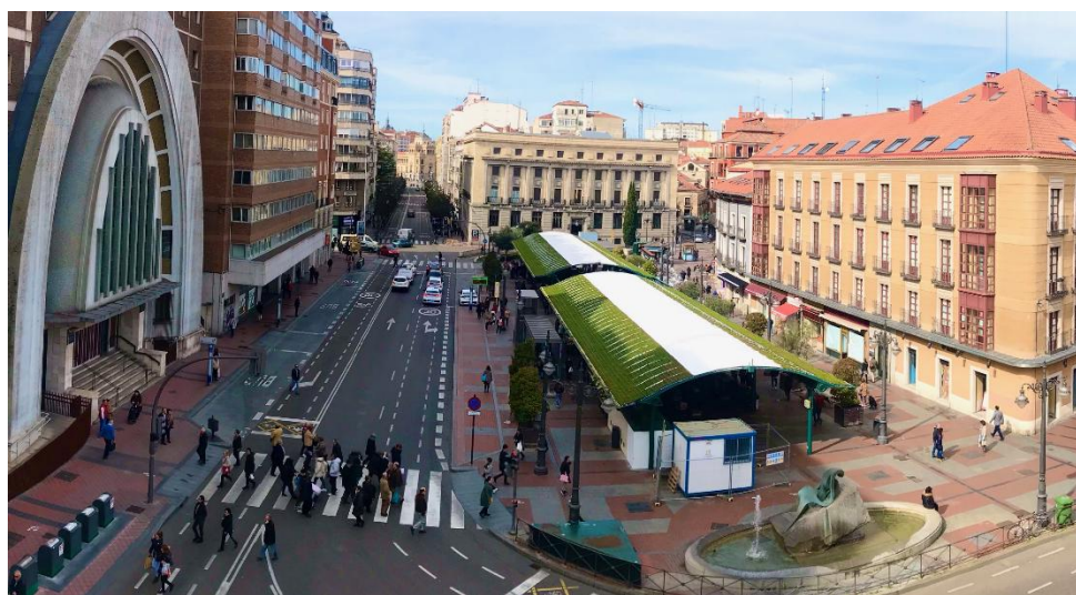
Figura 1. Cubierta verde en Valladolid (proyecto URBAN GreenUP)

Además, existen otras variables de carácter más social que se verán modificadas por la creación de estas áreas, como son el bienestar, la salud, la cohesión social o el incremento de la conciencia ecológica, entre otras. Ejemplo de ello es la siguiente imagen, en la que se muestra una cubierta verde instalada sobre la marquesina de un mercado de fruta. Además de servir como regulador térmico en la época estival, produce un atractivo añadido a la zona, sirviendo como reclamo a potenciales clientes. Este ejemplo da una idea de la heterogeneidad de los datos y variables a obtener, lo que se traduce en una gran complejidad a la hora de establecer el valor del impacto en su conjunto.