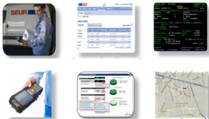
SAR (Driver Assistance System)