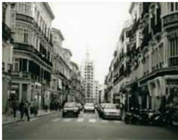
Calle Marqués de Larios sin peatonalizar.