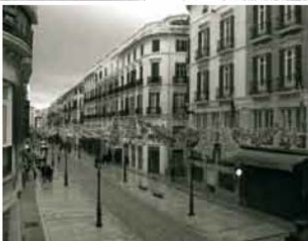
Calle Marqués de Larios tras ser peatonalizada.

Gracias a la implantación del sistema de accesos al Centro Histórico se ha conseguido reducir en un 89,3% las emisiones de CO 2 en este entorno protegido de interés económico, turístico y cultural.